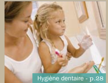
Hygiène dentaire - p.28