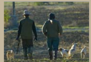
Les ACCA mobilisées - p.19