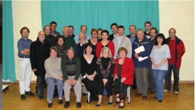
A Buxerolles, chaque conseil de quartier rassemble une trentaine de citoyens et dispose d'une enveloppe annuelle d'environ 10 000 euros.