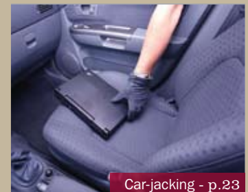
Car-jacking - p.23

- DÉJOUEZ LES NOUVELLES TECHNIQUES DES CAMBRIOLEURS