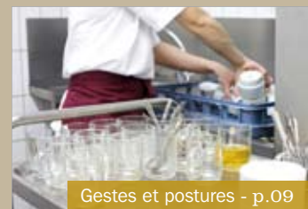
Gestes et postures - p.09

- LIVRON-SUR-DRÔME, UNE MAIRIE PRÉVENTION